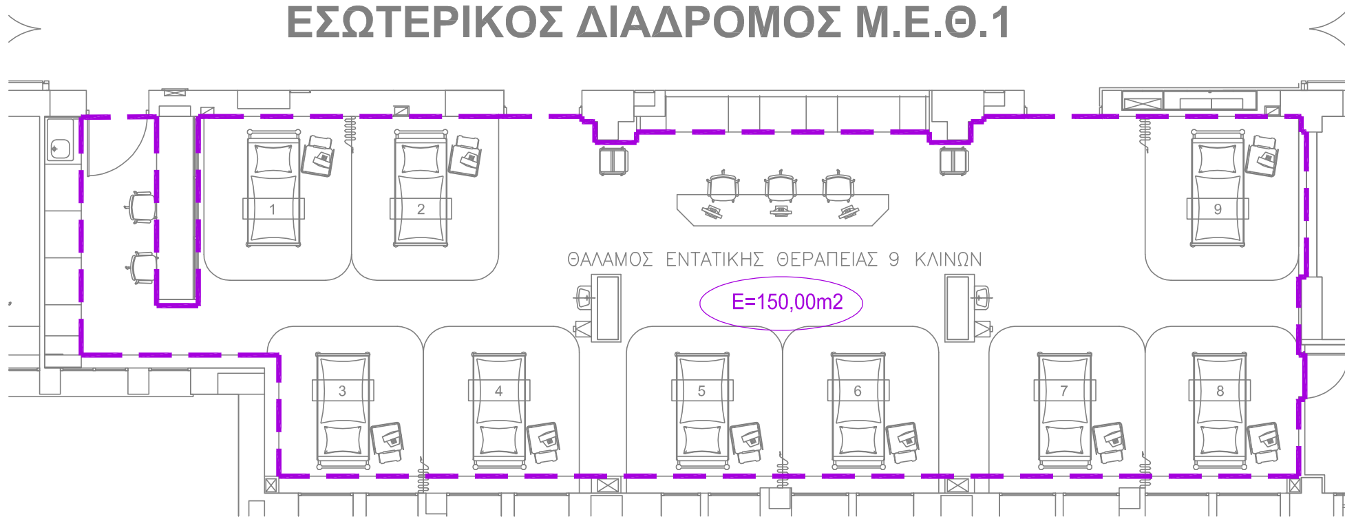
ΠΤΕΡΥΓΑ ΑΧΕΠΑ : ΜΟΝΑΔΑ ΕΝΤΑΤΙΚΗΣ ΘΕΡΑΠΕΙΑΣ 1 (Μ.Ε.Θ.1) - ΑΠΟΣΠΑΣΜΑ ΚΑΤΟΨΗΣ 3ης ΣΤΑΘΜΗΣ - ΚΛ.1/100