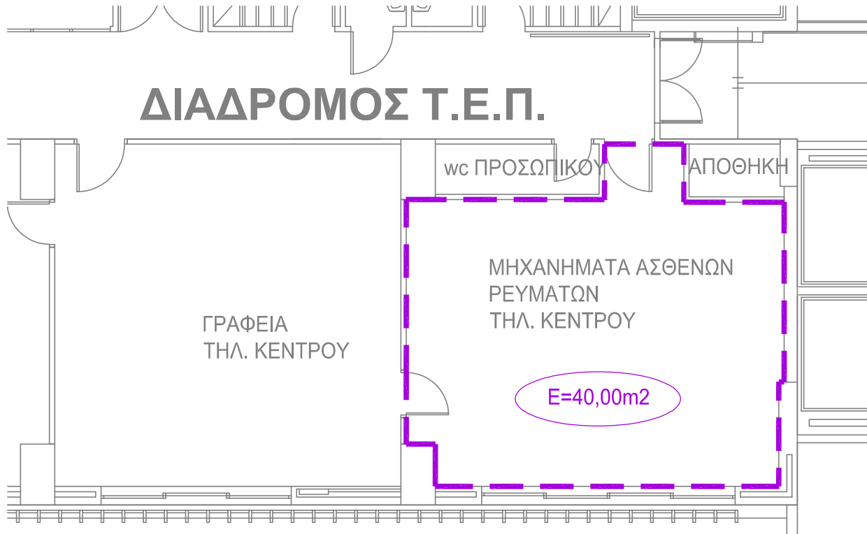
ΠΤΕΡΥΓΑ ΠΑΤΕΡΑ : ΓΡΑΦΕΙΟ ΑΣΘΕΝΩΝ ΡΕΥΜΑΤΩΝ - ΑΠΟΣΠΑΣΜΑ ΚΑΤΟΨΗΣ 2ης ΣΤΑΘΜΗΣ - ΚΛ.1/100